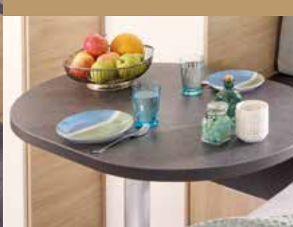
Tisch beim ALBA 350