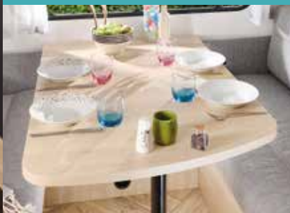
Tisch bei der Sport Line