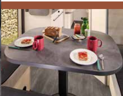
Tisch bei der Exclusive Line