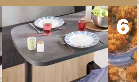
Tisch beim Alba